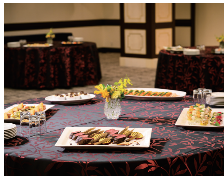
※プラン利用立食イメージ写真